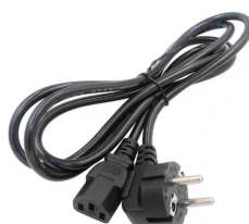
CAVO DI ALIMENTAZIONE